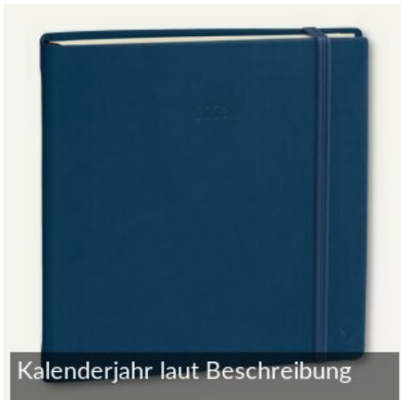
Kalenderjahr laut Beschreibung