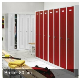
Breite: 80 cm

Antibakterielle Beschichtung der Stahlteile für Ihre Gesundheit mithilfe der Silberionentechnologie