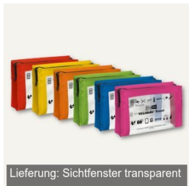
Lieferung: Sichtfenster transparent