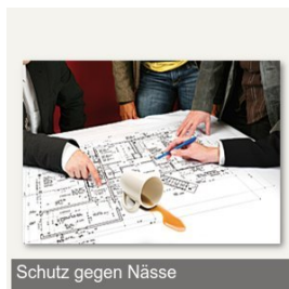
Schutz gegen Nässe

Sie finden diesen Artikel auch direkt unter: