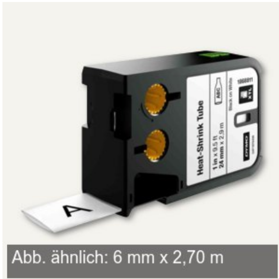
Abb. ähnlich: 6 mm x 2,70 m