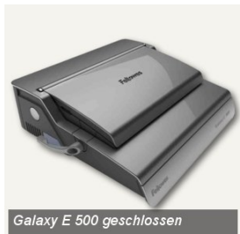
Galaxy E 500 geschlossen