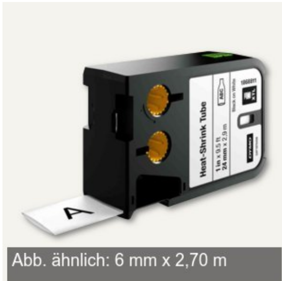
Abb. ähnlich: 6 mm x 2,70 m