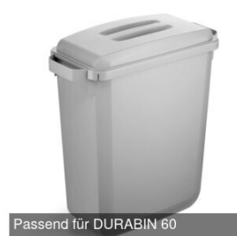
Passend für DURABIN 60